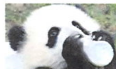
'BABY BOOM' PANDA China muestra los 34 cachorros del 2006